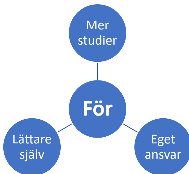
Figur 2. Uppfattningar för läxor

Eget ansvar uppgav som ett argument som talar både mot och för läxor. Eleverna anser att skolarbetet och därtill läxorna, är viktiga men att de ligger i den enskildes ansvar och görs efter eget omdöme.