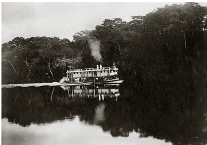
I de etnografiska museerna i Norden finns 40.000 föremål från Kongo. På vilka vägar har de kommit hit? Det frågas i vandringsutställningen Kongospår, ett samarbete mellan de etnografiska museerna i Norden, däribland Etnografiska museet i Stockholm.

Besättning på flodbåtarna i den ökända belgiska plundringen av Kongo bestod till stor del av sjömän från Norden. Foto: Johan Hammar 1911