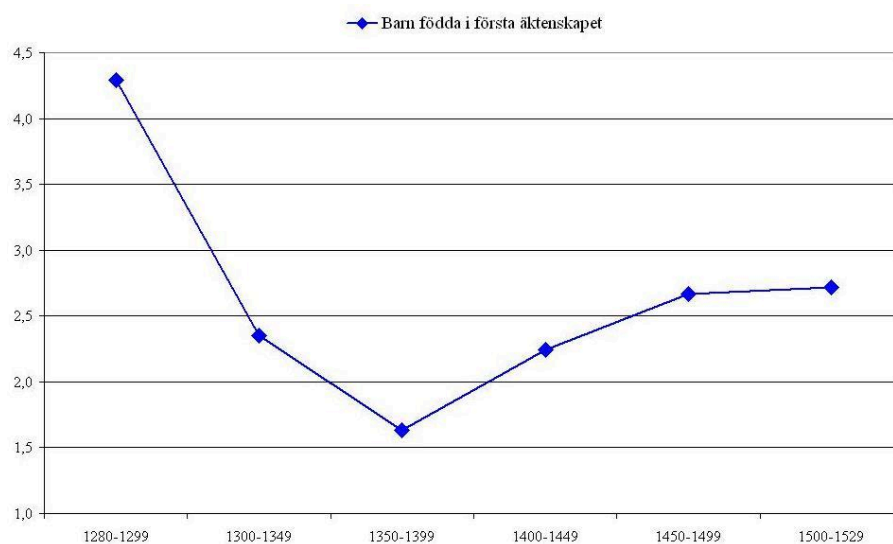
Diagram 2.3. Barnantal per familj födda i högfrälse kvinnors första äktenskap.

familjerna finner vi återigen likheter. Hertigarnas döttrar födda mellan 1330 och 1479 fick i genomsnitt 2,8 barn. 72 Det vill säga något högre men ändå jämförbart med siffrorna för det svenska högfrälset. Hur kunde barnantalet vara så lågt i en tid då få preventiva metoder fanns att tillgå och de metoder som fanns stred mot kyrkans bud? Fertilitet och reproduktionsnivå hos en befolkning brukar beräknas utifrån antalet barn per kvinna. Ovan beräknades barnantalet på alla gifta familjer vilket innebär att både första och efterföljande äktenskap har tagits med i uträkningen. Påverkar det resultatet så att det blir missvisande? För att kontrollera beräknades också antalet barn födda i högfrälse kvinnors första äktenskap (diagram 2.3). Att barnantalet inledningsvis är högre än i det tidigare diagrammet beror på att de inledande perioderna är olika långa. Annars överensstämmer de båda kurvorna med varandra.