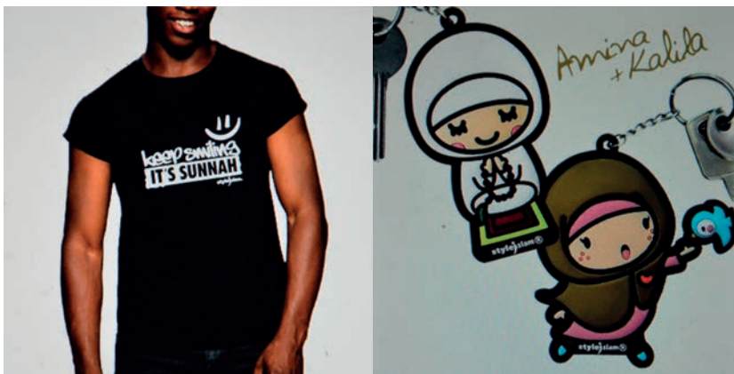
Produkter marknadsförda av företaget Styleislam©.