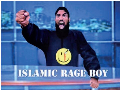
Islamic Rage Boy , en "glädjedödare" lanserad som internetmem. Originalfotot för denna manipulation är taget av Rafiq Maqbool (AP Photo).

handlar om skämtbilder producerade av individuella datoranvändare, som bildbehandlar fotografier och videoklipp och ger dem omfattande (viral) spridning i den form som har kommit att kallas internetmem (Börzsei 2013). 19 Somliga alster framstår inte som direkt politiskt och fientligt laddade, men anspelar på ett delat kulturarv där Islamic Rage Boys närvaro framstår som absurd, till exempel i ett kollage där hans ansikte får ersätta det ursprungliga i Edvard Munchs Skriet . Ofta handlar det dock om explicit förnedrande sammansättningar av Baths ansikte med blodiga, animala eller sexualiserade kroppar.