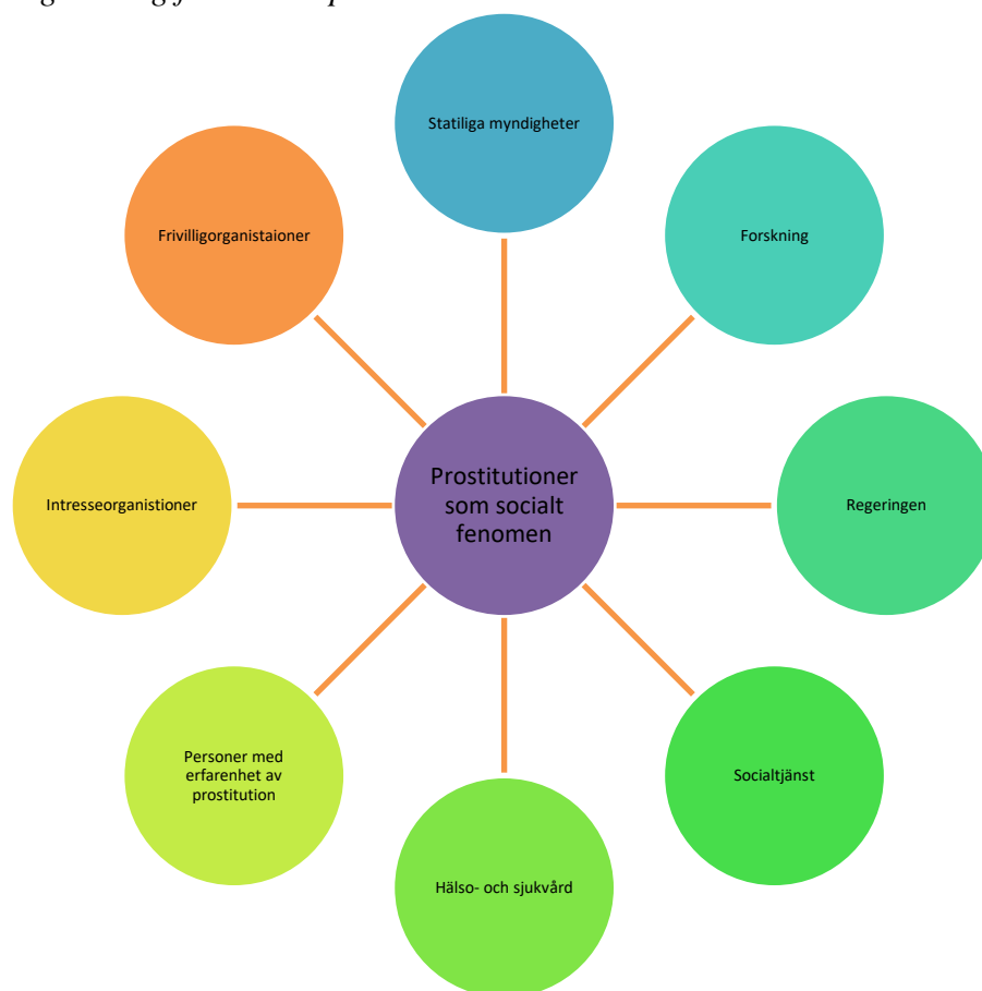
Figur 2. Illustration över de olika fält som under projektarbetet medverkat i dialoger kring fenomenet prostitution

Som framgår av figur 2 är det många olika aktörer vilka verkar inom olika diskursiva fält som medverkat och samtalat kring frågan om prostitution och de har alla olika ingångar till fenomenet och stundtals olika sätt att förstå och förklara det. Med diskurs avses här olika sätt att tala och tänka om fenomenet prostitution (se Sahlin 1999 och Jørgensen & Phillips 2000). Det sätt på vilket man talar och tänker är förbundet med vilken position man har till fenomenet exempelvis som lagstiftare, som hjälp- och/eller vårdgivare eller som vård- och hjälptagare, som forskare etc. Det som sker i en kunskapsproduktion som denna är att dessa olika aktörer möts, vilket är ett möte mellan olika handlings och tankemönster kring fenomenet. Det är ett språkligt möte där just den språkliga förståelsen gör att man ibland talar förbi och om varandra. Utifrån vår vetenskapliga horisont har också frågor om makt varit närvarande under hela processen inte minst mot bakgrund av att prostitutionsfrågan är ett ideologiskt och politiskt laddat fält. Det handlar inte bara om en horisontell maktrelation utan om en relationell maktkamp mellan olika synsätt på frågan om stöd och hjälp, om förståelser av prostitution, om vem och varför en person är i behov av stöd och hjälp. Vår intention har varit att genom forskningsdesignen skapa dialog mellan de olika fälten genom att synliggöra och verbalisera olika diskursiva föreställningar.